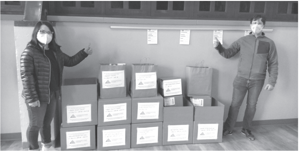
▲ 作者與先生一起服事，發放疫情援助物資

文章蒙允轉載自： https://www.cclife.org/View/Article/11035