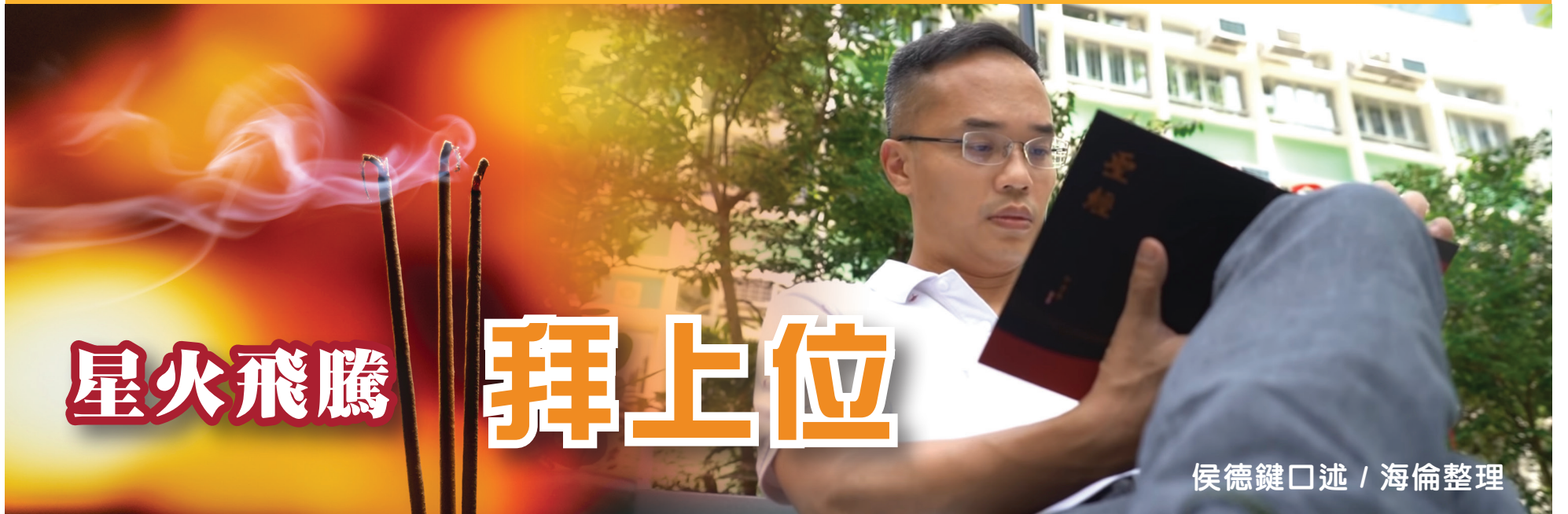
侯德鍵口述 / 海倫整理