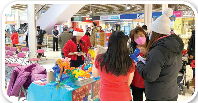
▲ 太古廣場攤位佈道