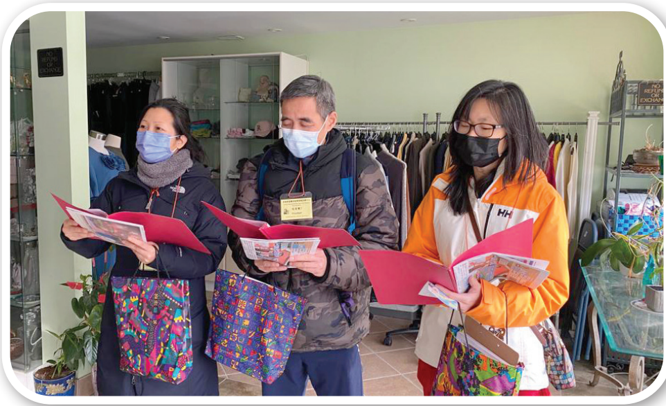
▼ 活力廣場攤位佈道

這次讓我學到了弟兄姐妹之間的配合、提醒、一起禱告、一起陪伴彼此鼓勵，一起打那美好的仗，為主收割莊稼！福音需要我們去傳揚，也是主耶穌交給門徒們的大使命，正如羅馬書10:13-15：「因為凡求告主名的，就必得救。然而人未曾信他，怎能求他呢？未曾聽見他，怎能信他呢？沒有傳道的，怎能聽見呢？若沒有奉差遣，怎能傳道呢？如經上所記：『報福音傳喜信的人，他們的腳蹤何等佳美！』」